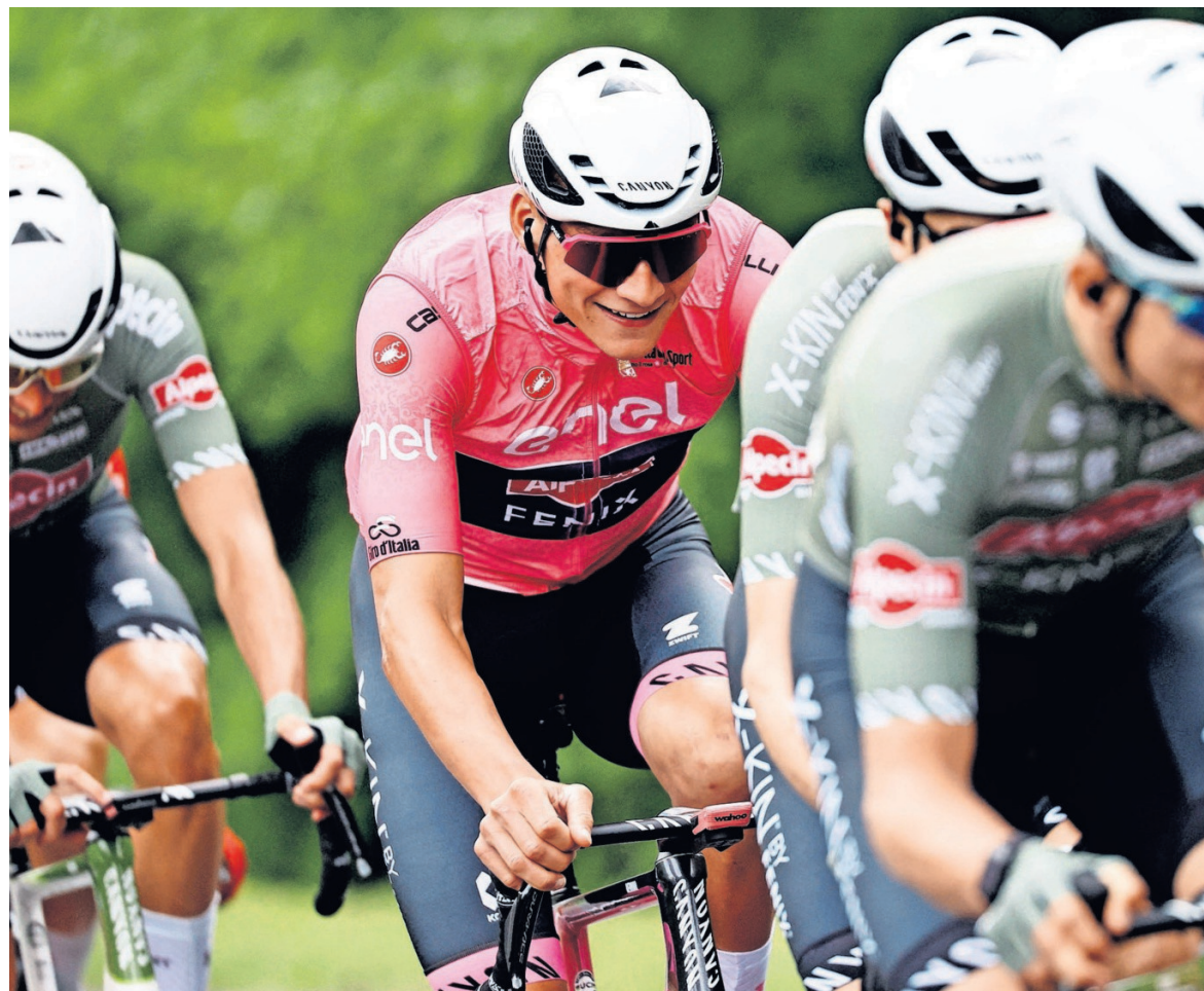
Mathieu van der Poel lachend op weg in de roze leiderstrui van de Giro.

Aan de andere kant moet de weelde ook niet te zeer worden